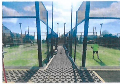
Padel Dia do Pai é iniciativa da Junta de Freguesia do Caniço.

O Dia do Pai, que se assinala no domingo, dia 19 de Março, é pretexto para uma ação de promoção da actividade de Padel no Padel Centro Caniço. Celebrar o dia com uma experiência diferente e para todas as idades é o que pretende a Junta de Freguesia do Caniço com a iniciativa gratuita, destinada a todos os pais residen-