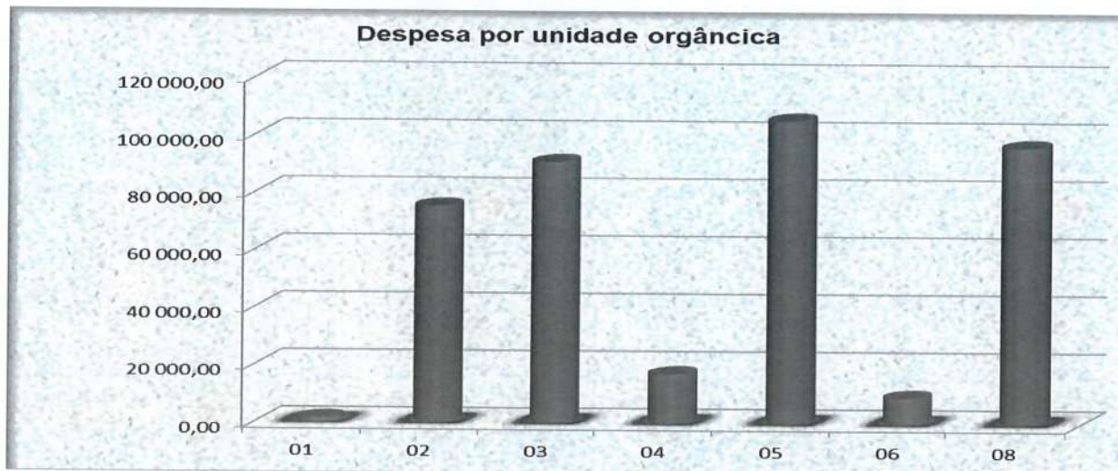
Gráfico n.º 3