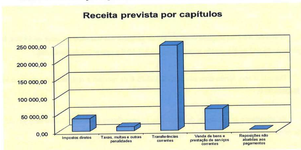
Gráfico n.º 1